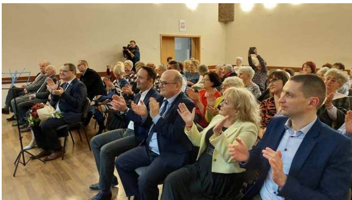
Podczas występów na 18 lecie Kaganka.

- Grudziądz w piosence – promocja śpiewnika i płyty „Piosenki o Grudziądzu” /26.06.2018 r.