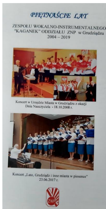
Biuletyn Kaganka na 15-lecie chóru