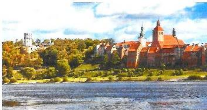
Program Piosenki o Grudziądzu