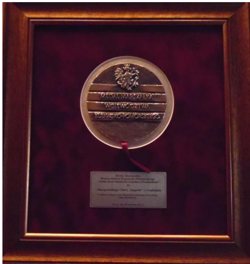
Medal Marszałka Województwa Kujawsko-Pomorskiego dla Kaganka