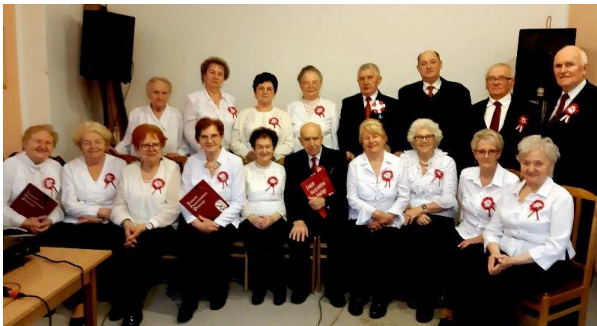
Aktualny skład Kaganka 2023 r.