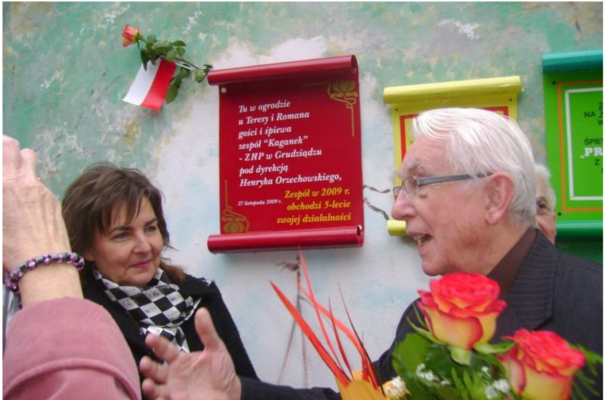
Odświeżenie tablicy pamiątkowej Kaganka w 2009 r.