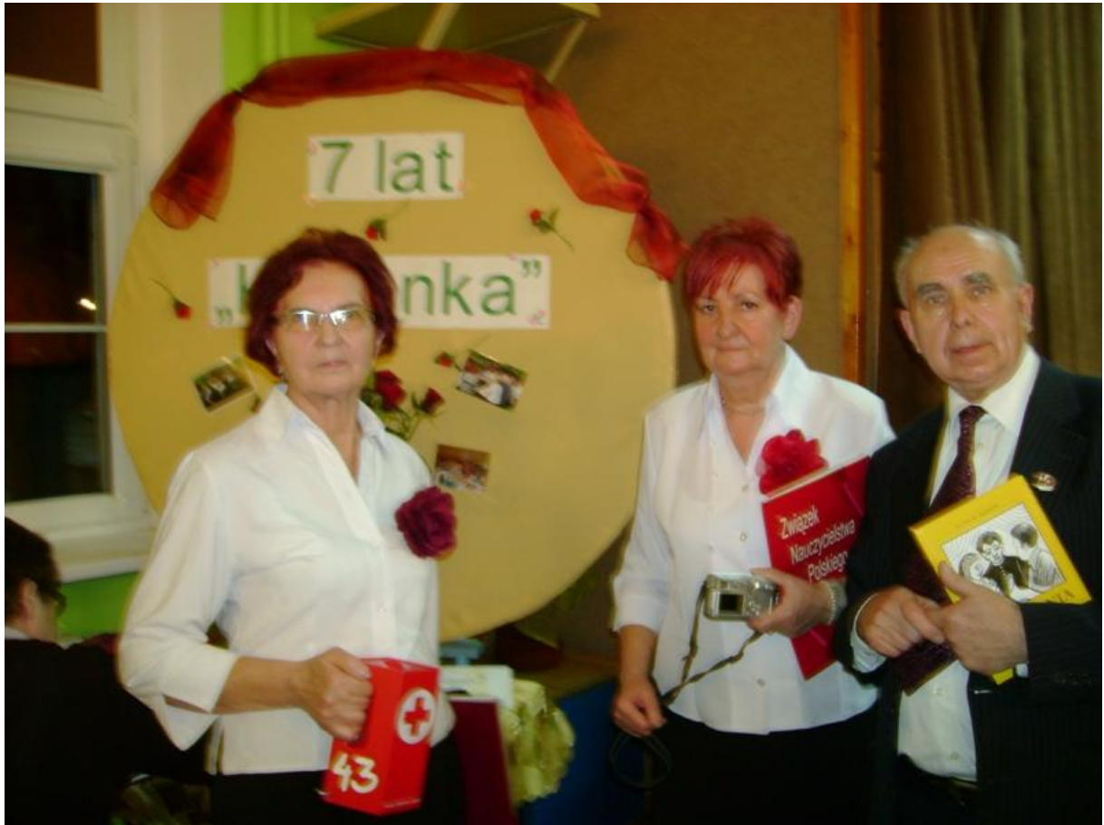
Świąteczna zbiórka na PCK 2011 r.

Podsumowując działalność „Kaganka” nie można pominąć prezentacji na portalach społecznościowych. Na facebooku i YouTube publikowane są nasze filmiki, zdjęcia i informacje o zespole. Obejrzeć nas można na facebooku, w portalach „Pozytywny Grudziądz” i „Kochamy Grudziądz”.