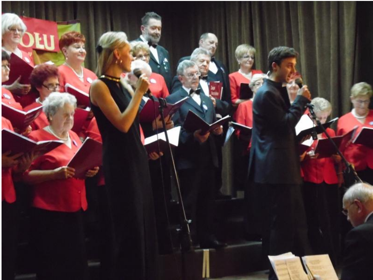
Wokaliści z Bydgoszczy występują wraz z Kagankiem