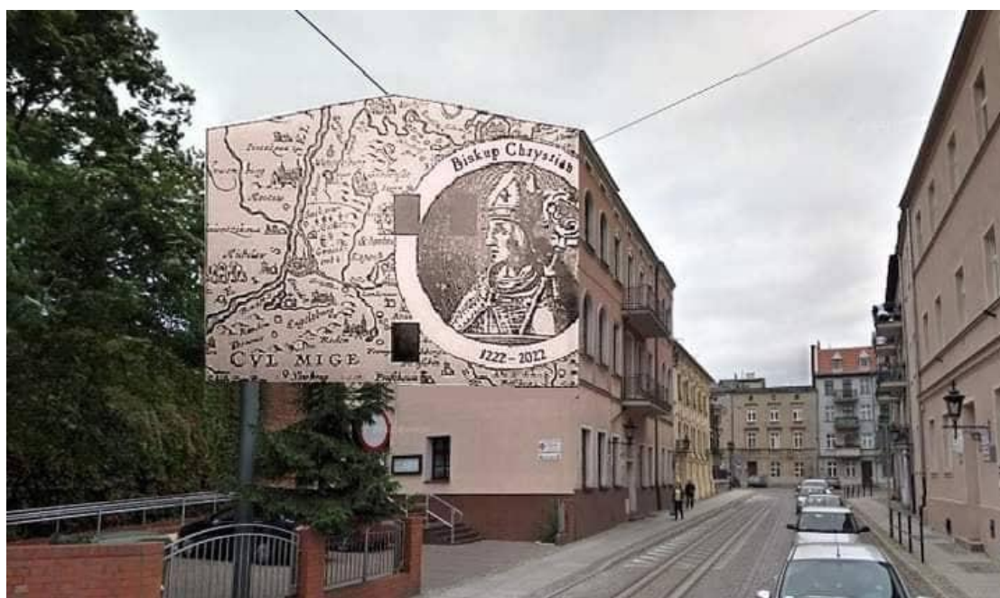
Mural, który ma ozdobić południową ścianę kamienicy Caritasu przy ul. Klasztornej w Grudziądz.

miasta prowadził stały ceglany most. Most, notabene najstarszy w Polsce, który przetrwał do dnia dzisiejszego i można jego najstarsze przesło oglądać z poziomu sztucznie usypanej Alei Chrystiana.