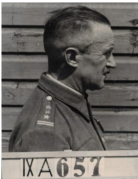
Podejrzany przed Sądem Berlińskim, 1942 r.

Dodatkowe informacje dotyczące kariery wojskowej pojawiły się w zbiorach Wojskowego Biura Historycznego im. gen broni Kazimierza Sosnkowskiego m.in.