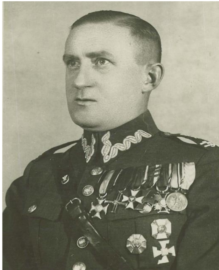
Zdjęcie do ankiety Virtuti Militari, 1933 r.