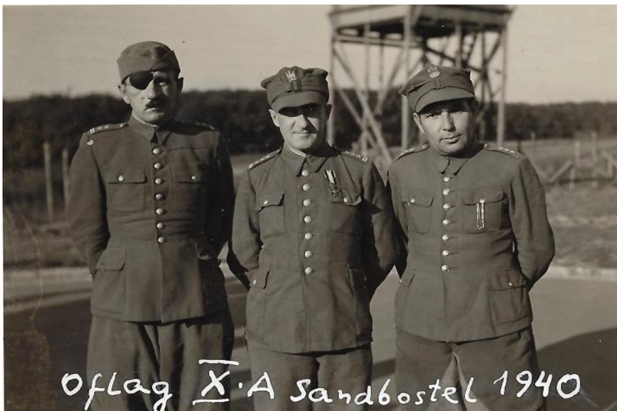
Oflag Sandbostel, 1940 r.

Dodatkowe informacje dotyczące kariery wojskowej pojawiły się w zbiorach Wojskowego Biura Historycznego im. gen broni Kazimierza Sosnkowskiego m.in.