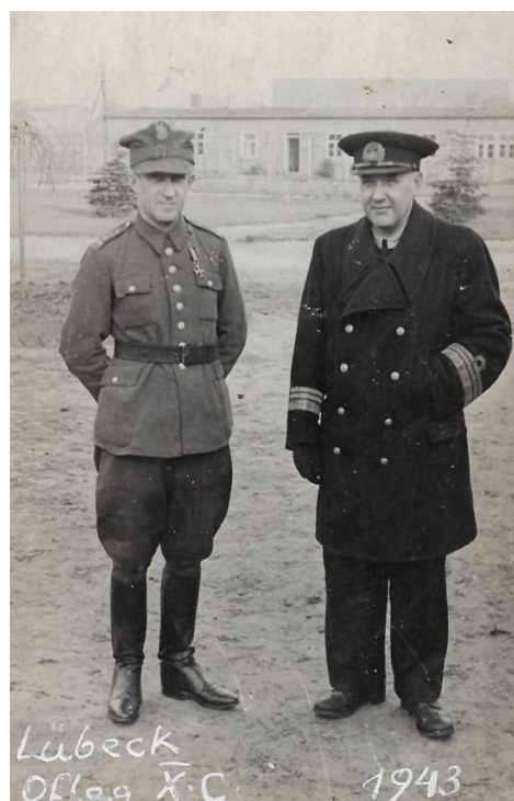
W Oflagu Lubeka, 1943 r.