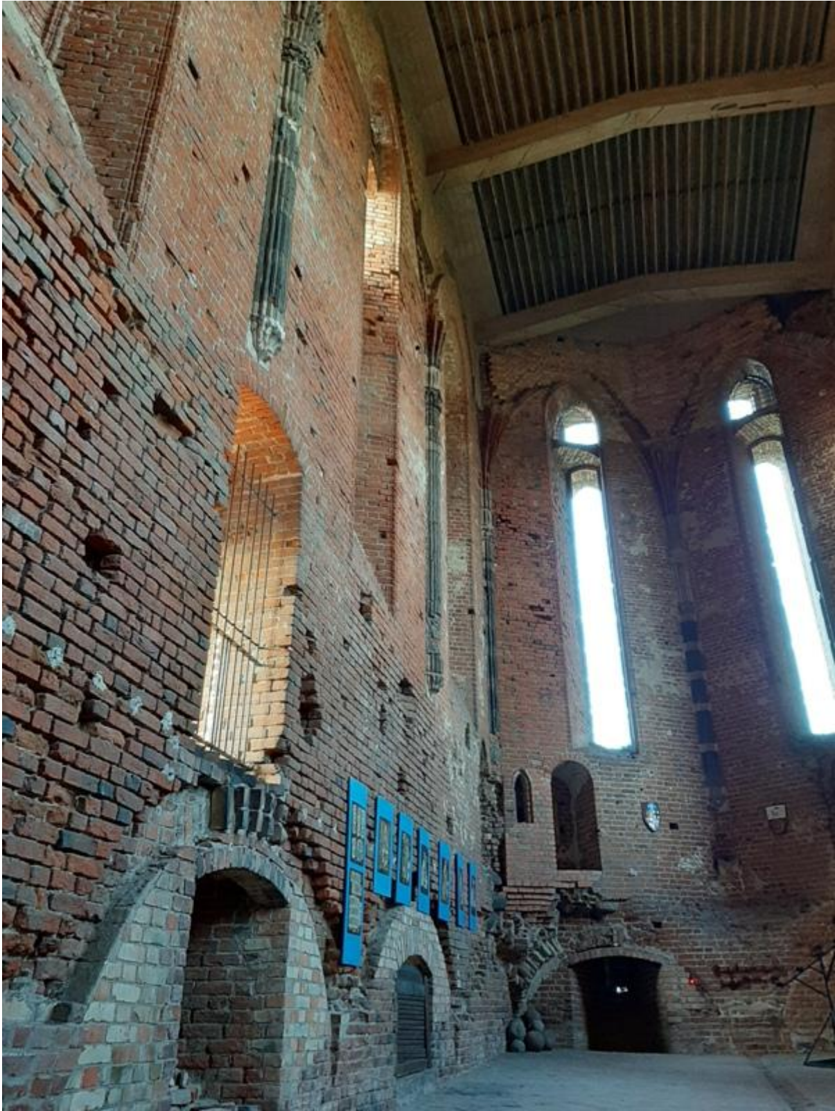
Widok na kaplicę zamkową, foto Justyna Malewska-Sempolowicz, archiwum prywatne poziomie znajdowały się tzw. przyziemia, czyli pomieszczenia będące magazynami