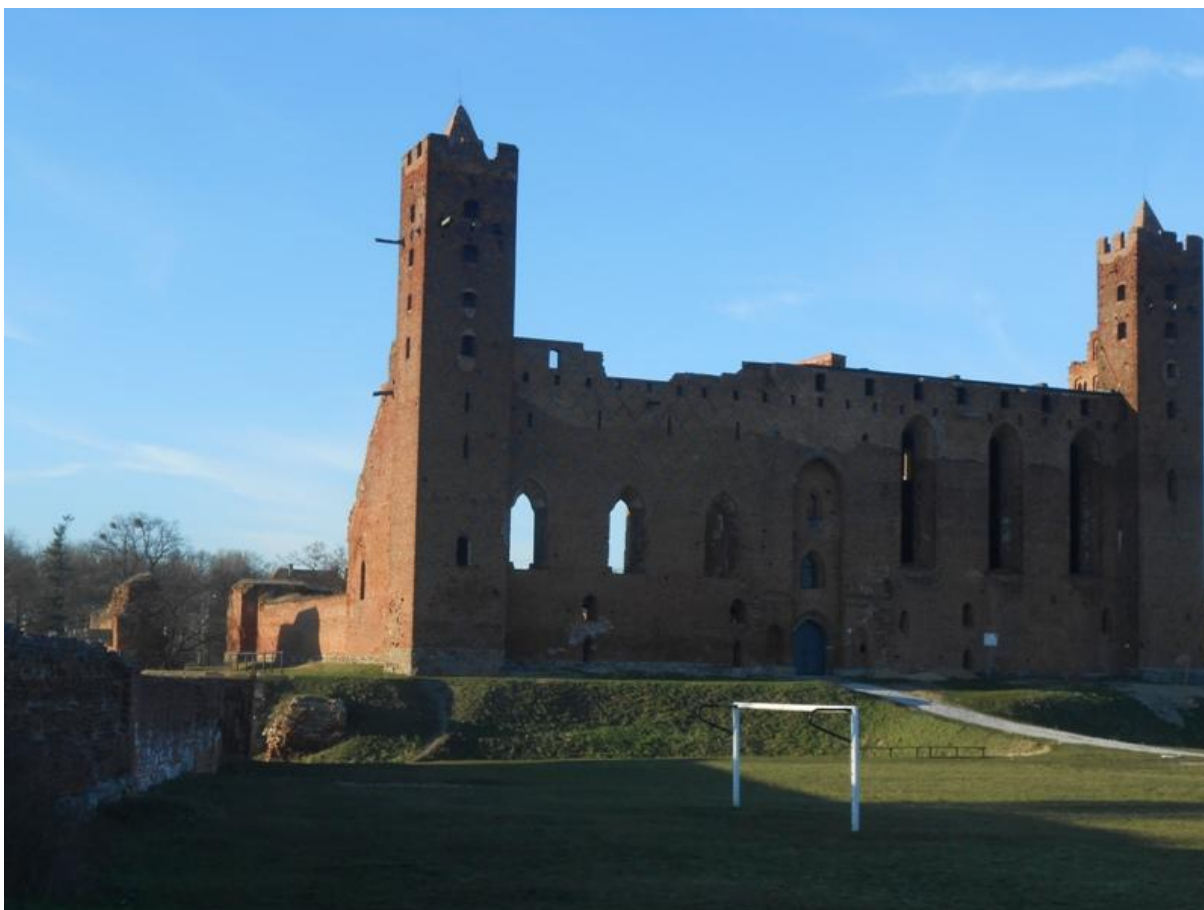
Południowa fasada zamku, foto Justyna Malewska-Sempolowicz, archiwum prywatne

Po drugim Pokoju Toruńskim cała Ziemia Chełmińska – w tym i Radzyń zostają przyłączone do Polski. Zamek w latach 1466 – 1772 jest siedzibą starostwa grodowego i miejscem sądów ziemskich oraz na zmianę z Kowalewem-Pomorskim, sejmików Ziemi Chełmińskiej.