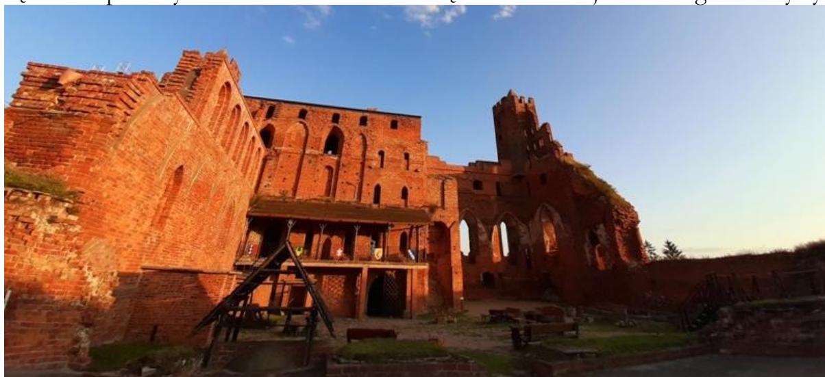
Widok na dziedziniec

Po zakończeniu działań II wojny światowej kontynuowano te działania, udało się nadbudować koronę murów wschodniej partii skrzydła południowego i pokryto kaplicę żelbetonową płytą, co zabezpieczyło pomieszczenie przed dostaniem się wód opadowych oraz umożliwiło tchnięcie w to miejsce nowego – turysty-