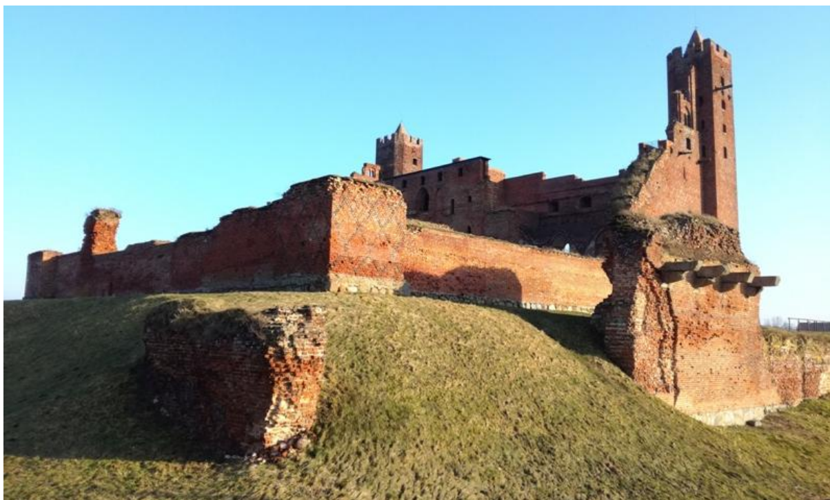
Panorama Zamku, skrzydło zachodnie z widocznymi pozostałościami po gdanisku, foto Justyna Malewska-Sempołowicz, archiwum prywatne

Po zakończeniu działań II wojny światowej kontynuowano te działania, udało się nadbudować koronę murów wschodniej partii skrzydła południowego i pokryto kaplicę żelbetonową płytą, co zabezpieczyło pomieszczenie przed dostaniem się wód opadowych oraz umożliwiło tchnięcie w to miejsce nowego – turysty-