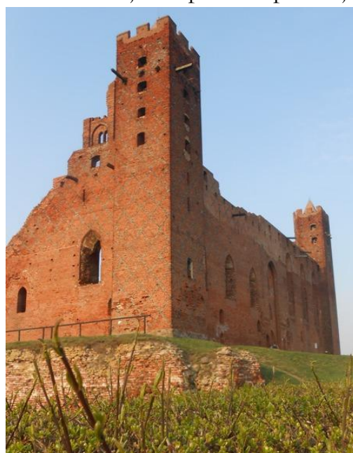
Zamek od strony południowo-zachodniej, fot. Justyna Malewska-Sempolowicz, archiwum prywatne

W roku 1397 zamek Radzyński zasłynął w historii faktem założenia tu tzw. „Związku Jaszczurczego” – grupy szlacheckiej urodzonych rycerzy polskich mającej na celu bronić ich praw. Organizacja prowadziła działalność opozycyjną w stosunku do Zakonu, chociaż oficjalnie działała w celu wzajemnej pomocy