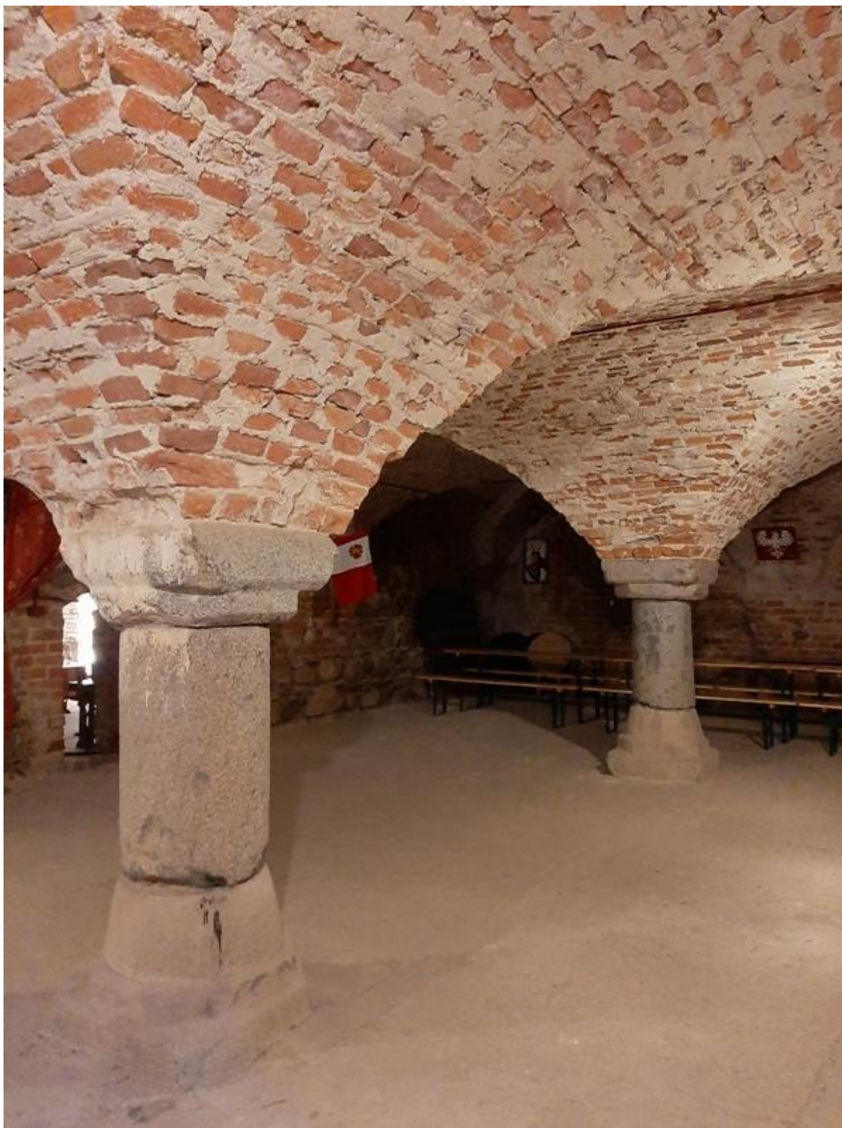
Widok na piwnicę zamkową

Zamek w Radzynie Chelmińskim jest typowym przykładem zamku konwentualnego (według „statutów” krzyżackich konwent stanowiło dwunastu braci plus komtur domowy – na wzór Chrystusa i dwunastu apostołów, w praktyce konwenty bywały mniej lub bardziej liczne) stanowiąc wzór budownictwa zamkowego