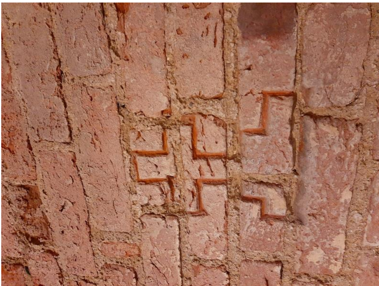
Jeden z "tajemnych znaków", pamiątka po planie filmowym serialu "Pan Samochodzik i Templariusze"

Historia najnowsza pisana jest cały czas na naszych oczach. Liczne wydarzenia, organizowane w klimatycznych murach zamku sprawiają, że warownia otrzymała nowe życie i może cieszyć kolejne pokolenia mieszkańców i turystów, którzy licznie odwiedzają to miejsce. Niepowtarzalnej oprawy wszelkim uroczystościom i wydarzeniom mającym, jako swoją scenerię ruiny zamku w Radzynie nadaje obecność współczesnych rycerzy – rekonstruktorów, członków dwóch bractw rycerskich mających swoje siedziby w zamku. Bractwo Rycerskie Zamku Radzyńskiego, popularyzuje wiedzę z zakresu historii i kultury średniowiecza, organizuje żywe lekcje historii, turnieje rycerskie, rekonstrukcje dawnych obrzędów takich jak np. Jare Gody czy Dziady, jarmarki oraz warsztaty historyczne. Członkowie bractwa w ramach swojej działalności prezentują m.in.: pokazy z nauką tańca średniowiecznego, warsztaty średniowiecznego rzemiosła (np. kaligrafii, lepienia z gliny, wykonywania lalek motanek), naukę strzelania z łuku, zabawy plebejskie i wiele innych aktywności mających na celu w ciekawy sposób zachęcić do zgłębiania wiedzy historycznej. Drugie bractwo – Bractwo Rycerskie Komturii Radzyńskiej wspiera działalność pierwszego jednak zajmuje się głównie artylerią średniowieczną, w swoich szeregach ma luczników oraz mincerza.