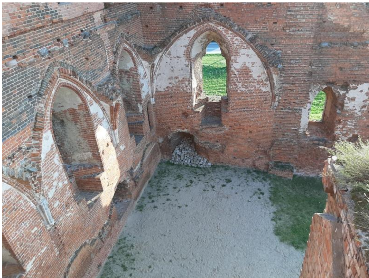
Widok na refektarz, foto Justyna Malewska-Sempolowicz, archiwum prywatne

w tamtych czasach. Prawdziwe arcydzieło sztuki budowlanej. Zamek – klasztor, jako siedziba Zakonu Szpitala Najświętszej Marii Panny Domu Niemieckiego w Jerozolimie, musiał łączyć w sobie zarówno funkcje obronne jak i klasztorne.