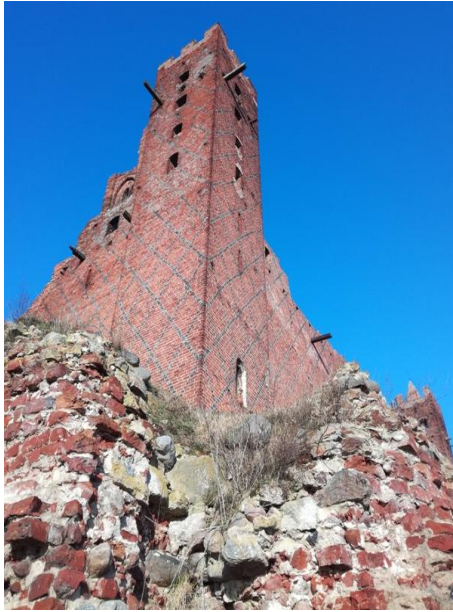
Wieża zachodnia