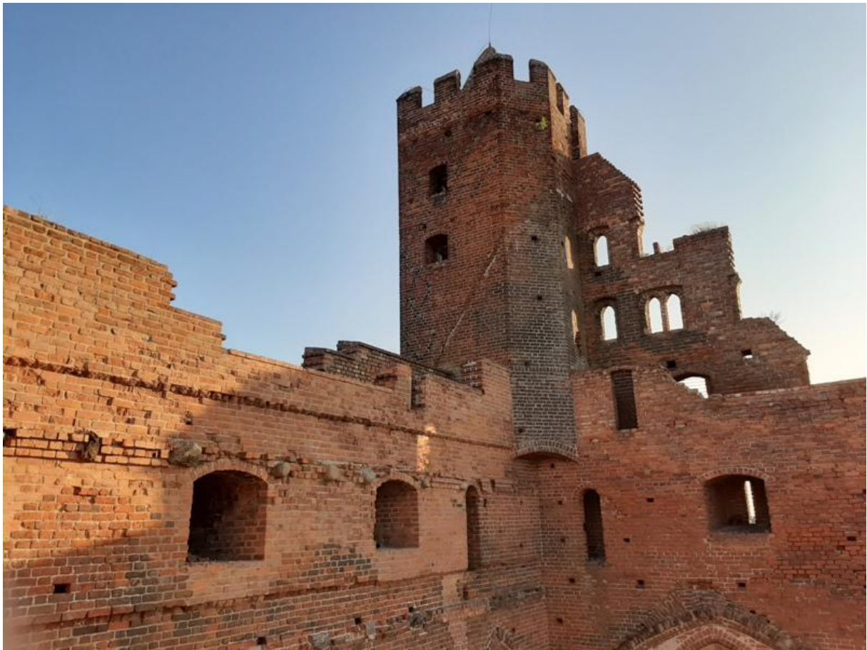
Widok na wieżę zachodnią z tarasu drugiego piętra zamkowego

bramna, nad którą znajdowały się dwa pomieszczenia, pierwsze to zamkowa kancelaria oraz piętro wyżej komnata, w której znajdował się mechanizm podnoszący brzoję bramną. Od wschodu orientowana, kaplica p.w. Św. Krzyża. Jednonawowe, przesklepione gwiazdźście pomieszczenie było jednym z najważniejszych miejsc na zamku, od strony dziedzińca przylegały do niej trzy cele pokutne, wyposażone w specjalne okna skierowane w stronę ołtarza, tak by osadzeni mogli uczestniczyć w nabożeństwie. Skrzydło wschodnie zamku mieściło kapitułarz – miejsce obrad konwentu oraz dormitorium, czyli wspólną zakonną sypialnię. W skrzydle północnym znalazło się miejsce na infirmerię, czyli zamkowy szpital, a dalej kuchnię. Zachodnia część zamku należała do komtura domowego, to z tego skrzydła dzięki przerzuconemu przez międzymurze gankowi można było dostać się do, gdaniska, czyli wieży ustępowej. Najwyższa partia zamku, już nie tak reprezentacyjna, przeznaczona była, jako magazyn lekkich przedmiotów oraz pomieszczenia dla służby, to tutaj znajdowały się również krużganki obronne wyposażone w wąskie okienka lucznicze. Całość wieńczył dwuspadowy dach kryty dachówką.