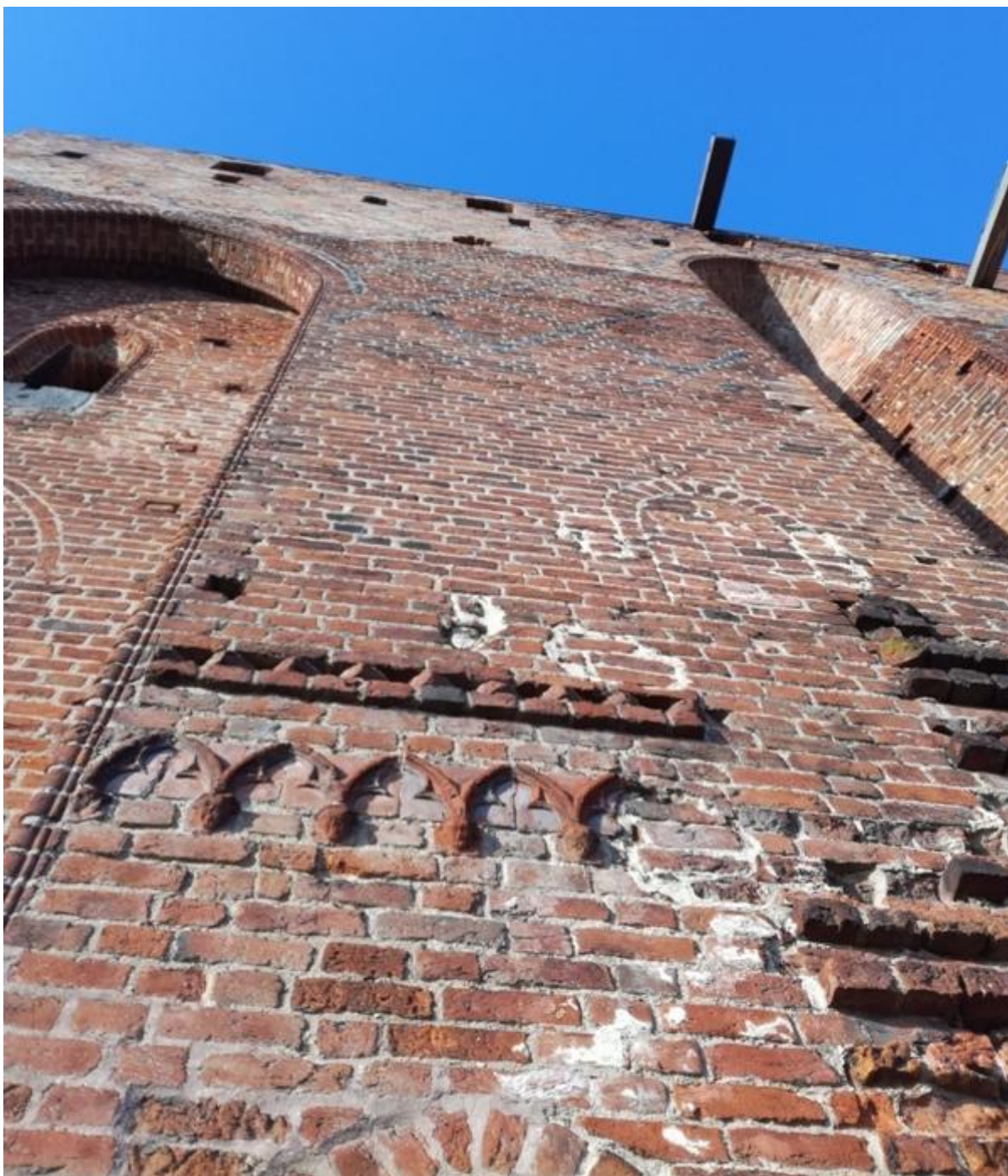
Ozdobny fryz arkadowy przy bramie wjazdowej zamku

oraz piece ogrzewające najważniejsze zamkowe pomieszczenia. Hipokaustum, bo tak fachowo nazywamy średniowieczny system ogrzewania podłogowego, doprowadzało rozgrzane powietrze do poszczególnych sal przy pomocy specjalnych kanałów grzewczych. Poniżej poziomu dziedzińca znajdowały się zamkowe piwnice, w których przechowywano żywność. Najważniejsze na zamku było natomiast reprezentacyjne pierwsze piętro. To właśnie tutaj toczyło się całe życie zakonne i znajdowały się najważniejsze pomieszczenia. Kolejno: w zachodniej części skrzydła południowego znajdował się refektarz, czyli zamkowa jadalnia, dalej szyja