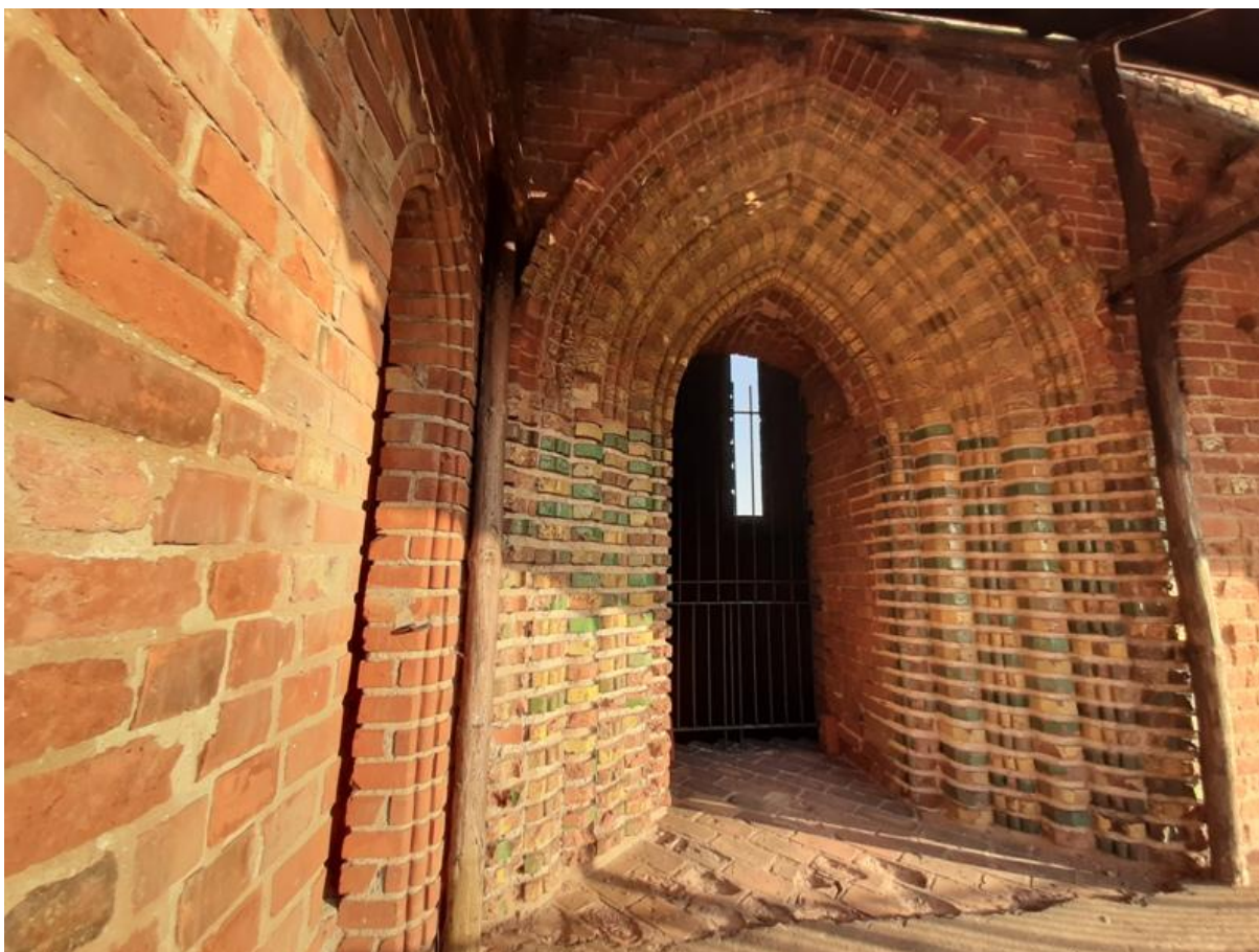
Wejście do Kaplicy zamkowej, ozdobne oryginalnymi zielono-żółtymi ceglami glazurowanymi, portal

materialnej i tworzeniu wspólnoty towarzyskiej. Miasto było ich oficjalną siedzibą, posiadali również wikarie w tutejszym kościele. Inicjatorem i założycielem Towarzystwa Jaszczurczego jest znana w Grudziądzu postać Mikołaja z Ryńska. Chorążego Zakonu, który podczas wielkiej Bitwy pod Grunwaldem opuścił chorągiew Ziemi Chełmińskiej, dając znak kapitulacji. Przez Krzyżaków oskarżono go o podjęcie przedwczesnej decyzji i okrzyknięto zdrajcą. Jak czytamy u Jana Długosza „Mściwym toporem Krzyżackim ścięto Mu głowę” na rynku w Grudziądzu.