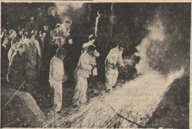
Na zdjęciu: Pierwszy spust surówki z wielkiego pieca w hucie im. Bolesława Bieruta w Częstochowie.

Biuro Wykonawcze uchwaliło tekst deklaracji w sprawie przygotowań do III Światowego Kongresu związków zawodowych, odezwę do mas pracujących na całym świecie o poparcie kampanii na rzecz rokowań zainicjowanej przez Światową Radę Pokoju, jak również deklarację na temat prowokacji faszystowskiej z 17 czerwca w Berlinie.