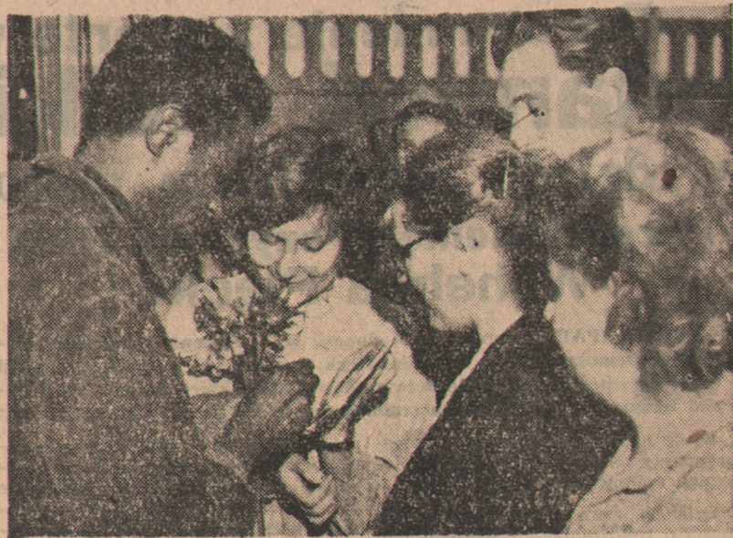
Do Warszawy przybywają zagraniczni studenci — delegaci na III Światowy Kongres Studentów, który rozpocznie się w dniu 27 bm.

Podczas dwudniowych obrad uczestnicy konferencji dokonali oceny pracy techników i ośrodków szkolenia rolniczego w roku szkolnym 1952—1953 oraz omówili zadania, jakie przed nauczycielami tych szkół stoją w nowym roku szkolnym.