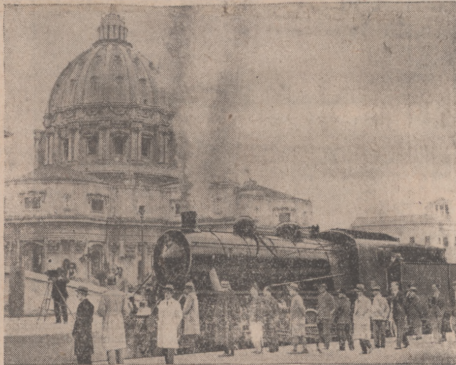
PIERWSZY POCIĄG WATYKANU.

Jak widać, dyktatura faszystowska „wysanowała” gruntownie Włochy. Widocznie skutki rządów dyktatorskich we wszystkich krajach są jednakie, bo i w Polsce mamy również wielki niedobór budżetowy.