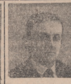
Zawada, p. Kromnice, dn. 24 maja 1931 r.