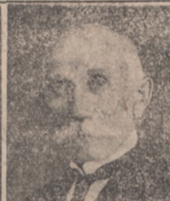
Sbyntten b. Neidenburg, Prusy Wschodnie, dn. 4. 10. 30.

Zawładaniom W. Panów, że po użyciu trzech przesyłek „Fregalin” mimo moich 73 lat, czuję się zupełnie zdrowym.