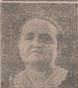
Herischdorf w/Rsgb., Weichrichsbergstr 10, d. 29. 4. 31.

przekonają Szan. Państwa o skuteczności naszego od lat znanego środka odradzającego nrew i nerwy „Fregalin” dowody, które poniżej przytaczamy. Tysiące osób, które „Fregalin” używały, nie zawiodły się. „Fregalin” działa nadzwyczajnie u cierpiących na nerwy, brak sił, ogólne osłabienie, zawroty głowy i bóle reumatyczne. Prosimy upewnić się o tem u lekarza. — Do ciężkiej walki o byt codzienny potrzeba silnych nerwów i zdrowej krwi. — Należy uważać, co niżej podpisani twierdzą o skuteczności tabletek „Fregalin”, ażeby zdać sobie sprawę z doniosłości tego nadzwyczajnego środka. — W archiwum naszym znajdują się tysiące takich podziękowań, napływających samorzutnie z kraju i z zagranicy, a które każdego czasu w biurze naszym przejrzeć można. — Wszelkie podziękowania są notarialnie zatwierdzone — „Fregalin” otrzymać można w każdej aptece. — „Fregalin” sporządzony jest pod naukowym nadzorem.