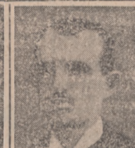
Lublin, ul. Leśna 22, dn. 1. 6. 31.

Z radością donoszę W. Panom że wszelkie objawy moich chorób, jak: obstrukcja bóle w krzyżu, ramionach, nogach i biodrach, oraz ogólne osłabienie, po trzymiesięcznej bardzo sumiennie przeprowadzonej kuracji tabletkami „Fregalin” zniknęły zupełnie. Na dowód mojej wdzięczności nie mogę znieść słów podziękowania. Wróciły mi one zdrowie i spokój, co jest nieocenioną skarżą.