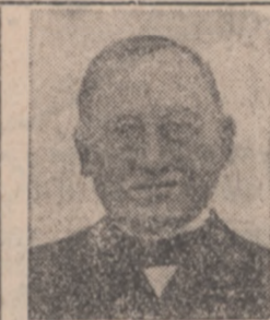
Göttingen, Breymanstrasse 6/J. 3. 10. 30.

Cierpięta na dolegliwości podbrzusza, ucisk w pierśsiach, bóle głowy i bezsenność. Już po jednorazowej kuracji tabletkami „Fregalin” wszystkie wyżej wymienione niedomagania minęły. Obecnie czuję się zupełnie zdrow i silny.