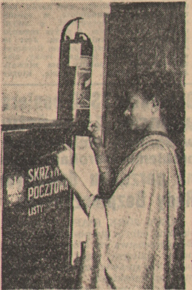
Delegatka Indii wysyła kartę z pozdrowieniami do przyjaciół w dalekiej ojczyźnie.