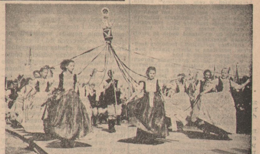
Radosne, rozśpiewane i roztańczone szeregi płyną w korowodzie dożynkowym.