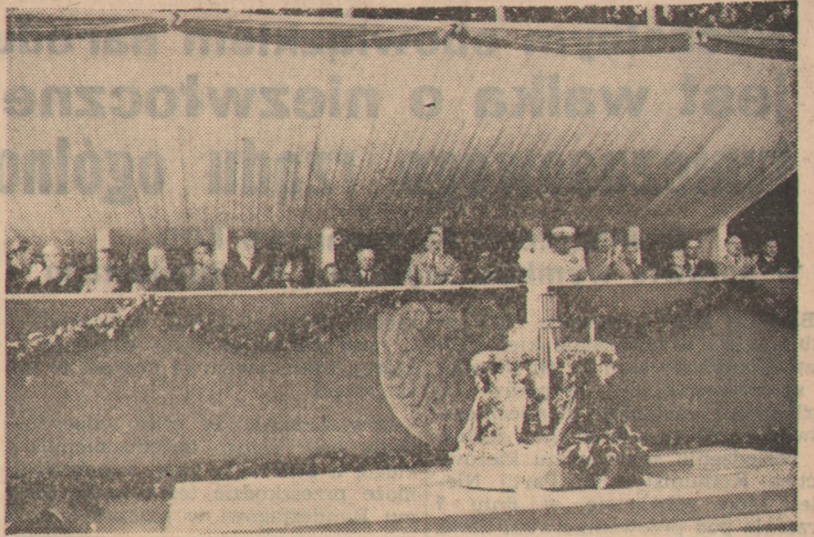
Trybuna honorowa. Przemawia gospodarz dożynek — Prezes Rady Ministrów Bolesław Bierut.