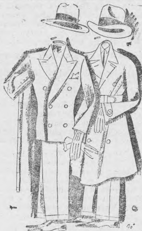
Dzisiejsi młodzi ludzie. (najważniejsze części składowe).