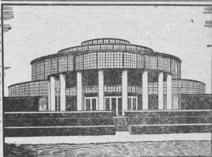
Hala dancینگowa na P. W. K.

Z targami hodowlanymi połączone będą konkursy hipiczne oraz międzynarodowa wycieczka naukowo-rolnicza, organizowana pod auspicjami Dra J. Lutosałwskiego.