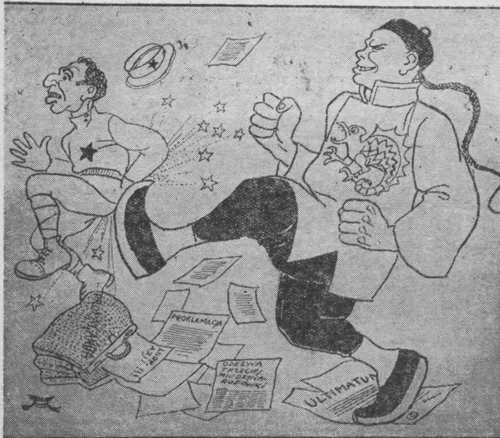
Burza nad Azją.

Chińczycy wypędzili Rosjan z Mandżuli i Pogranicznaja. Szanghaj. Według wiadomości, które tu nadeszły z frontu, zajęte przez wojska sowieckie stacje pograniczne zostały odebrane przez oddziały konnicy chińskiej, która ruchem oskrzydającym zmusiła do natychmiastowej ewakuacji tych punktów. Oddziały rosyjskie wycofały się w zupełnym nieładzie. Konnicy chińskiej udało się zagarnąć część taboru i kilka wozów amunicji.