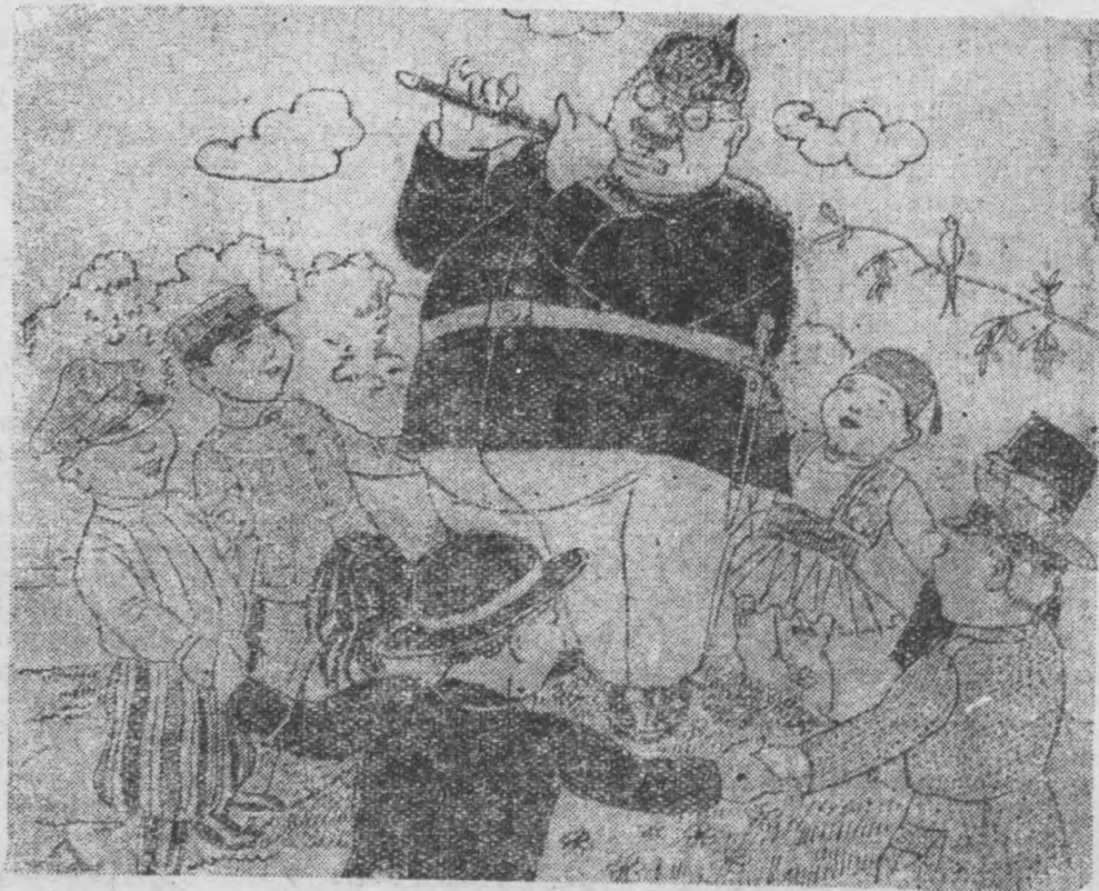
Jak Niemcy wyobrażają sobie Pan-Europę?