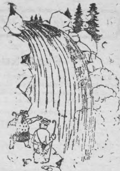
„Weź sobie przykład, ty nie- dołęgo, który nie umiesz nawet zreparować natrysku w naszej łazience!“ („Rire“)