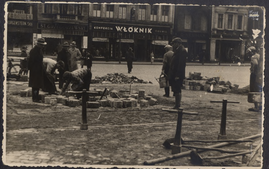
Remont Starego Rynku - rok 1937