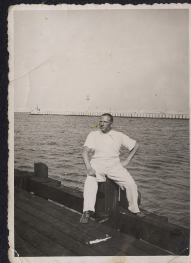
i na wspólnym wypoczynku