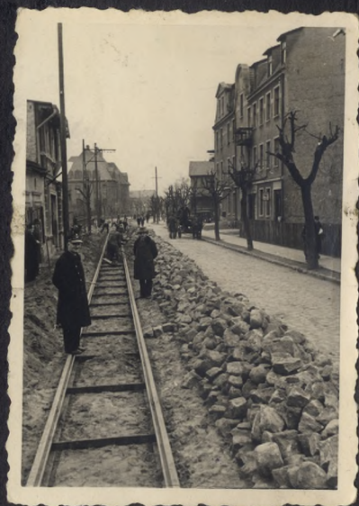
Zdjęcia z budowy linii tramwajowej w ul. Chodkiewicza od ul. Gdańskiej / obecne Al. 1 Maja / do ul. Lelewela.

Przedsiębiorca Leon Bukowski z Kierownikiem Tramwaji Miejskich w Bydgoszczy