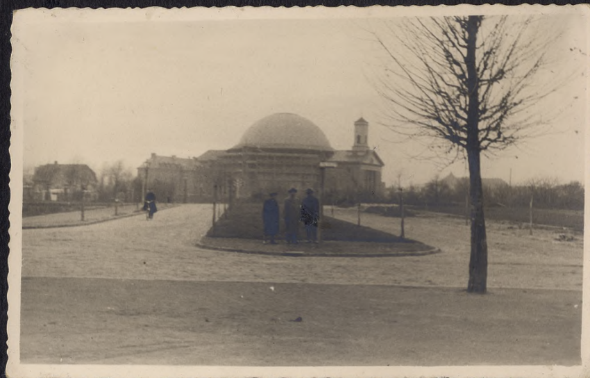
Wykonana nawierzchnia brukowa - ul. Sportowa w Bydgoszczy