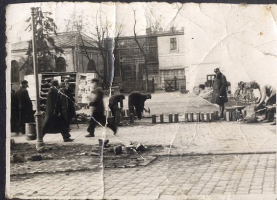
2 - ulice pomiędzy Pomorską a Sienkiewicza rok 1934