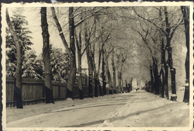
1 - wybudowana ul. Sportowa rok 1933