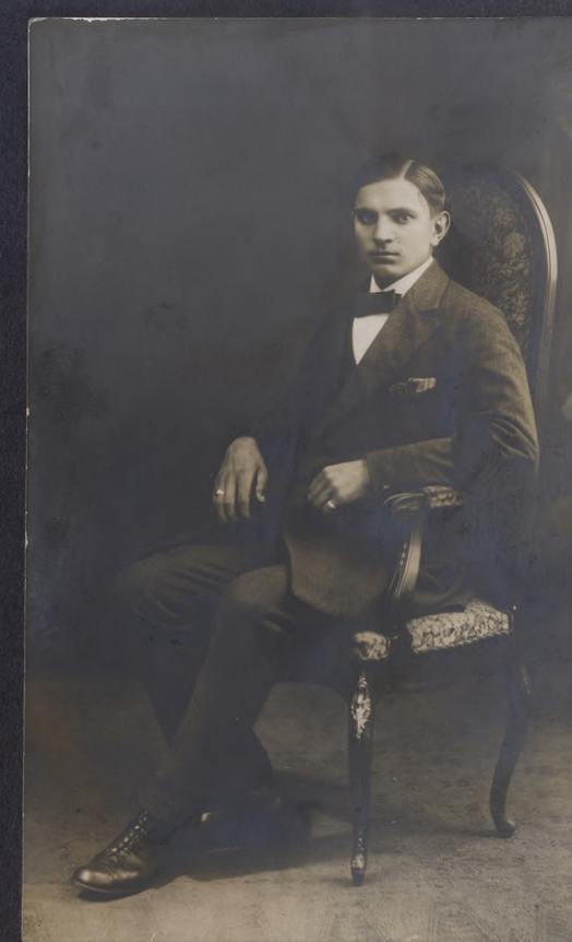
w wieku kiedy przejmował