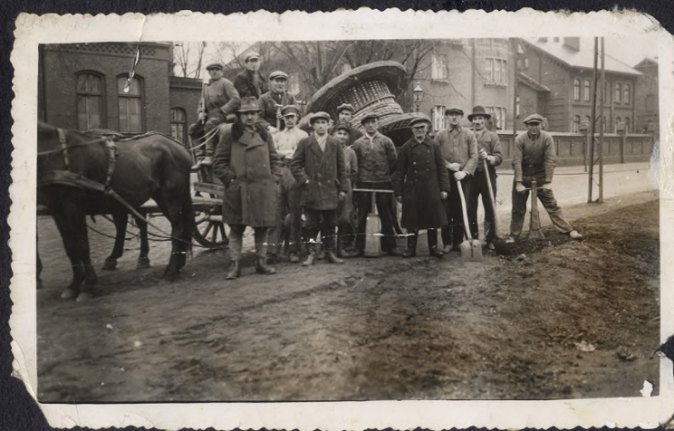
3 - układanie kabla rok 1935