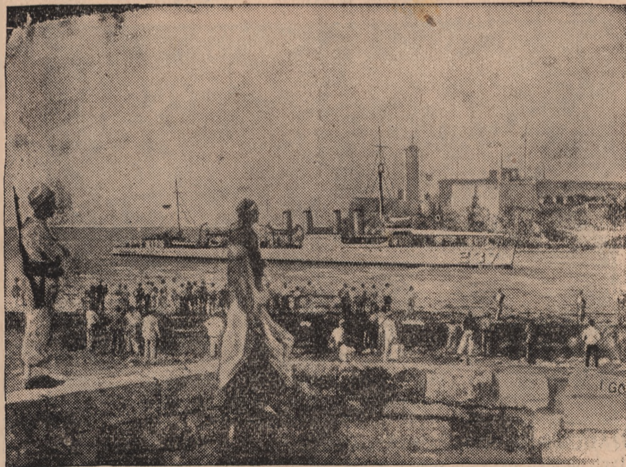
AMERYKAŃSKIE STATKI WOJENNE U GRANIC KUBY.

Camaguey udając się na Havanę. Oddział wojsk wysłany przeciwko powstańcom prowincji Camaguey owdładnął ratuszem w Moron bez rozlewu krwi. Policja miejscowa, która przeszła na stronę powstańców, została rozbrojona.