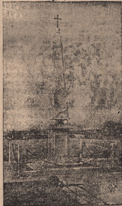
POMNIK SOBIESKIEGO POD WIEDNIEM.

Podjęto śledztwo w celu wyjaśnienia faktu dla jakich przyczyn człowiek ten przez połowę zgorą swego życia odgrywał rolę kobiety.