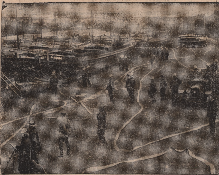
Jak wiadomo, wybuchł ponownie strajk flisaków francuskich. Na zdjęciu straż ogniowa pilnuje porządku.

przedsiębiorstwa żeglugowe. Takie same zatory strajkujący flisacy zakładają i w wielu innych punktach rzek i kanałów gdzie żegluga jest szczególnie ożywiona. Władze bezpieczeństwa są bezsilne wobec poczynań strajkowych flisaków.