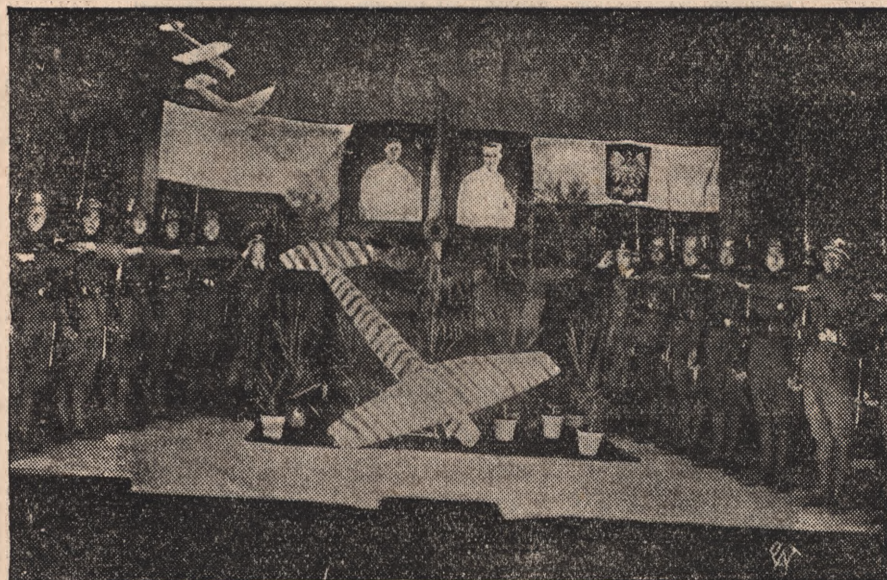
W HOLDZIE S. P. ŻWIRCE I WIGURZE.

W czasie akcji policja była atakowana kamieniami i kijami, w