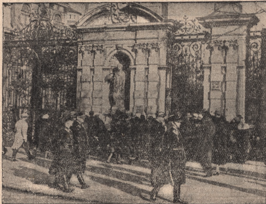
UNIwersytet warszawski zamknięty.

W obu wypadkach obrona zgłosiła apelację.