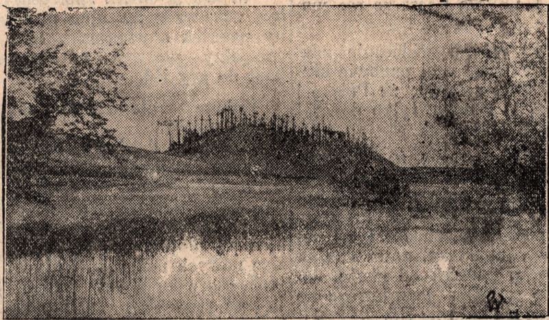
Zdjęcie przedstawia malowniczo położony cmentarz w miejscowości Siauliai na Litwie.