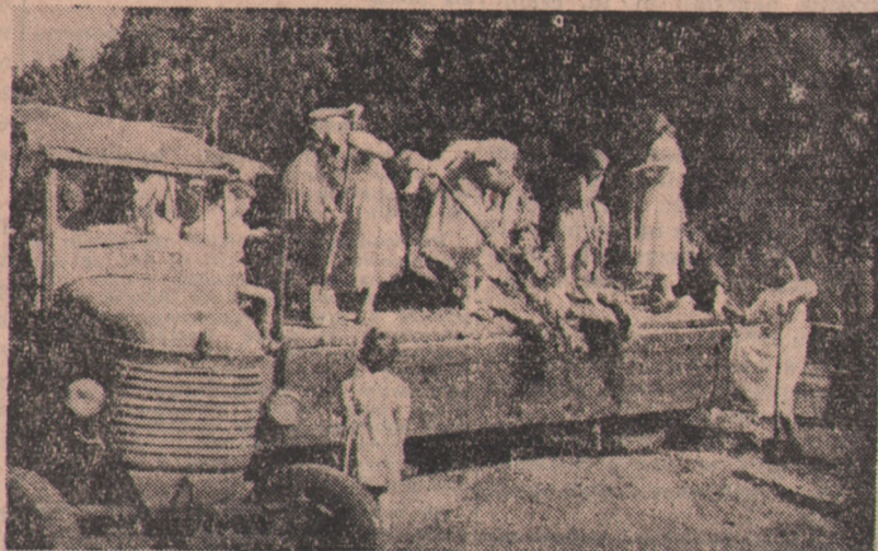
Uczestnicy uzdań leczniczych w Połczynie-Zdroju sami budowali w tym roku „sanatorium na wolnym powietrzu” w pięknym Parku Zdrowym.