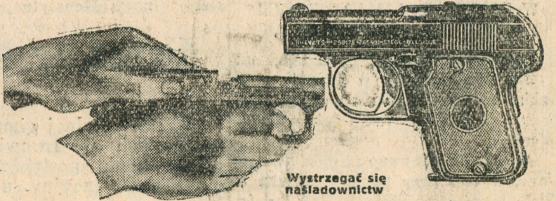
Wystrzegać się naśladowictw

Automat 6 mm. wyrzucający sam gilzy po wystrzale otworem bocznym w lufie, strzelający do celu metalowymi kulkami lub srułem do ptactwa, pięknie oksydowany, płaski, „Mabis”, syst. „sportowy” zapewnia całkowite bezpieczeństwo osobiste. Automat ten stanowi prawdziwą rewelację w dziedzinie fabrykacji broni. Wyrzeka sam gilzy po każdym wystrzale i automatycznie się resetuje (patrz rysunek). Wykonany jest luksusowo o precyzyjnej konstrukcji, nie zaczyna się, nie psuje i może służyć na długie lata. Huk ogłaszający. Nadaje się do obrony mieszkań, dla pp. automobilistów, inkasentów i t. d. Cena tylko zł. 7.35. 2 szt 14 zł. Setka kul „Flobert” zł. 3.65. Szczoteczkę do czyszczenia lufy dajemy darmo. Wysyłamy bez zezwolenia polic. Płaci się przy odbiorze. Adres dla listów: Jener, Przedst. „MONTRE”. Warszawa 1, Pl. Napoleona skr. 827 B.