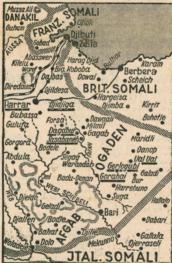
Mapka terenów działań wojennych w Abisynji.

Kuratorja szkolne przygotowują zarządzenia w sprawie tegorocznych ferj zimowych w szkolnictwie średnim i powszechnym. Wobec zmiany w podziale roku szkolnego najbliższe ferje Bożego Narodzenia zostaną skrócone w porównaniu z rokiem szkolnym 1934—1935. W roku bież., przerwa zimowa w zajęciach szkolnych trwać ma tylko od 23 grudnia do 9 stycznia włącznie.