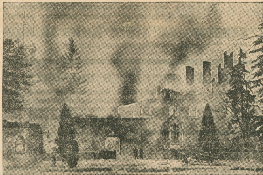
Pożar historycznego zamku

Takie motywy nieobjęła amnestja emigrantów przytacza rządowy projekt ustawy.