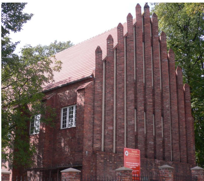
Kościół św. Jana, ul. Szkolna 10 w Grudziądzu