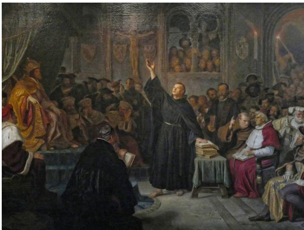
Marcin Luter na sejmie w Wormacji, 1521 r.