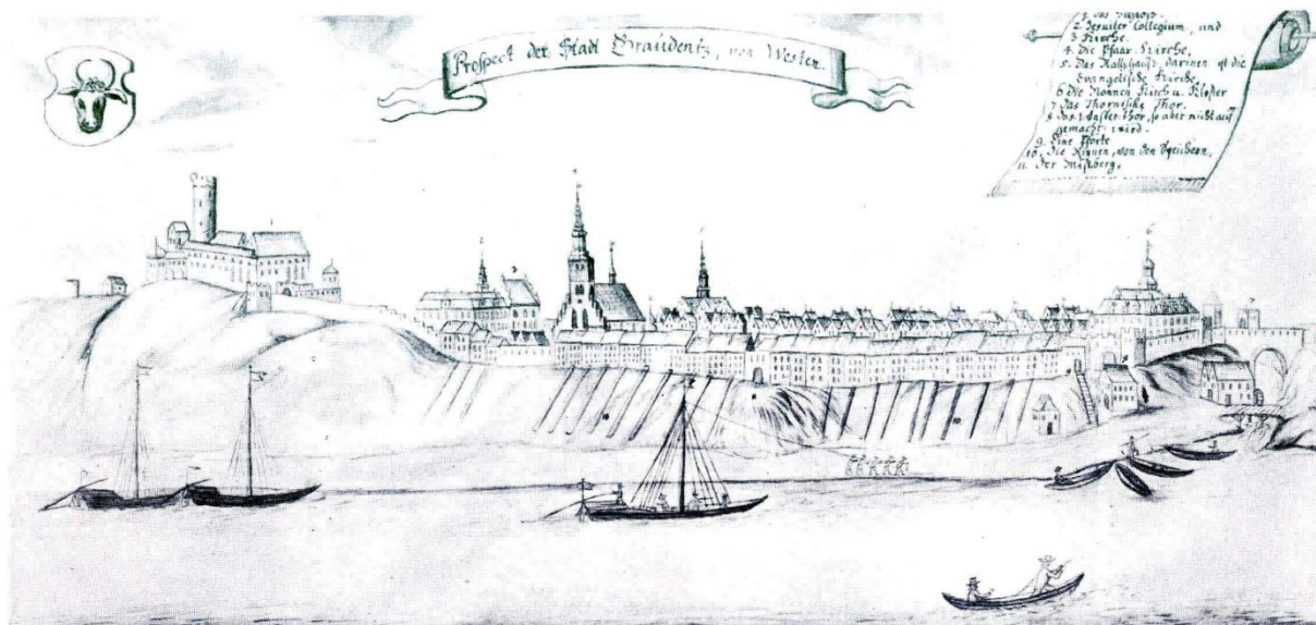
Panorama Grudziądz XVIII w. Steiner