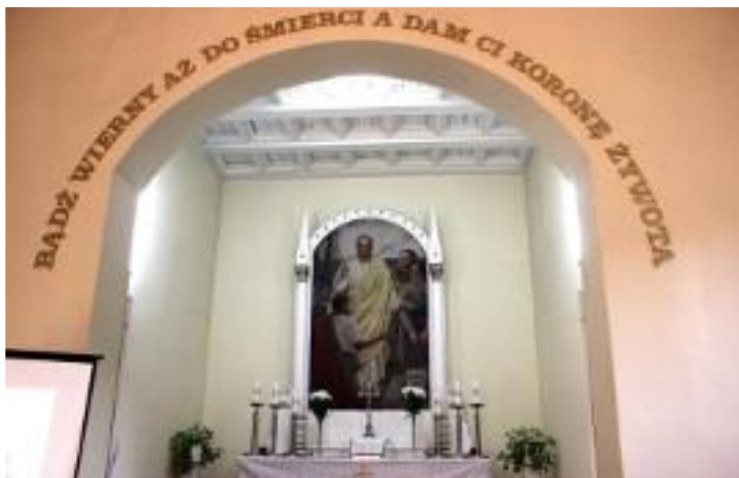
Ołtarz w Kościele św. Jana w Grudziądzu.