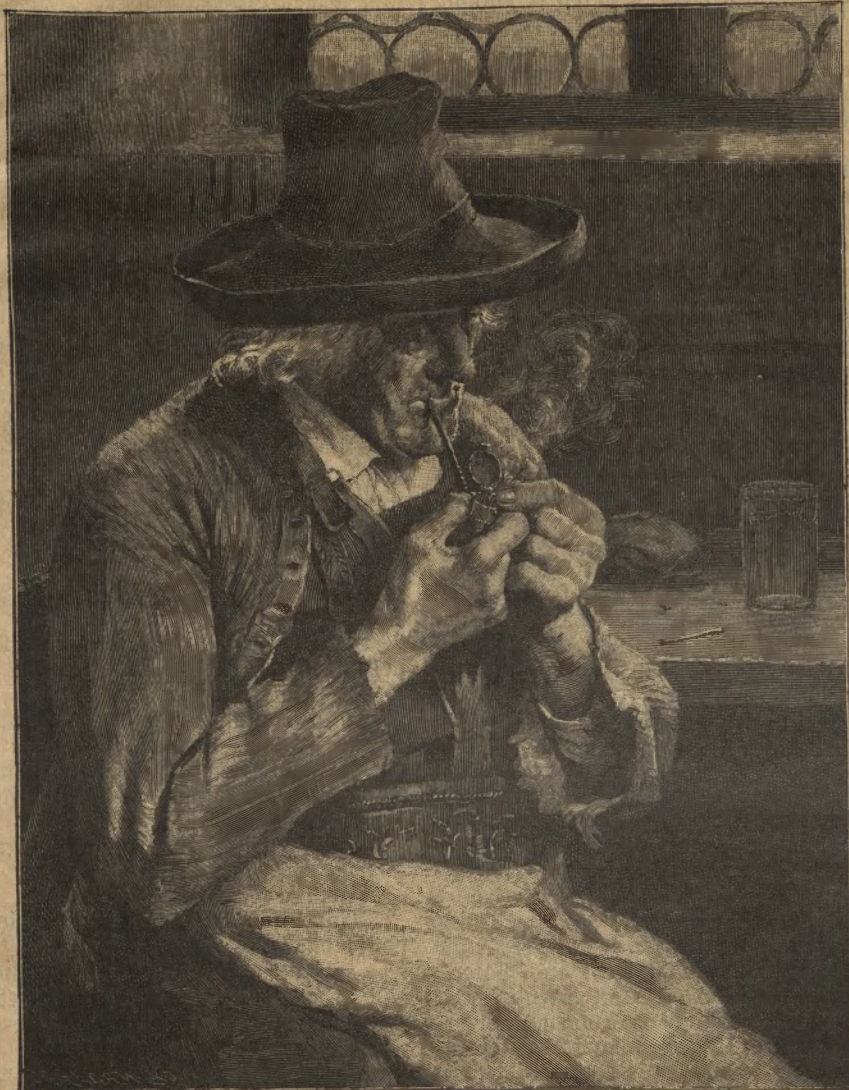
Der Raucher. Nach dem Gemälde von H. Lindenschmitt.

„Morgen sehen wir uns wieder,“ sprach sie ihm leise nach, dann sah sie, wie er langsam die Stufen hinabstieg und im Dunkel verschwand, nur seine Schritte hörte sie noch eine Weile auf dem Kies — dann war sie allein, wie festgebannt an ihren Platz durch das große friedensbringende Glück!