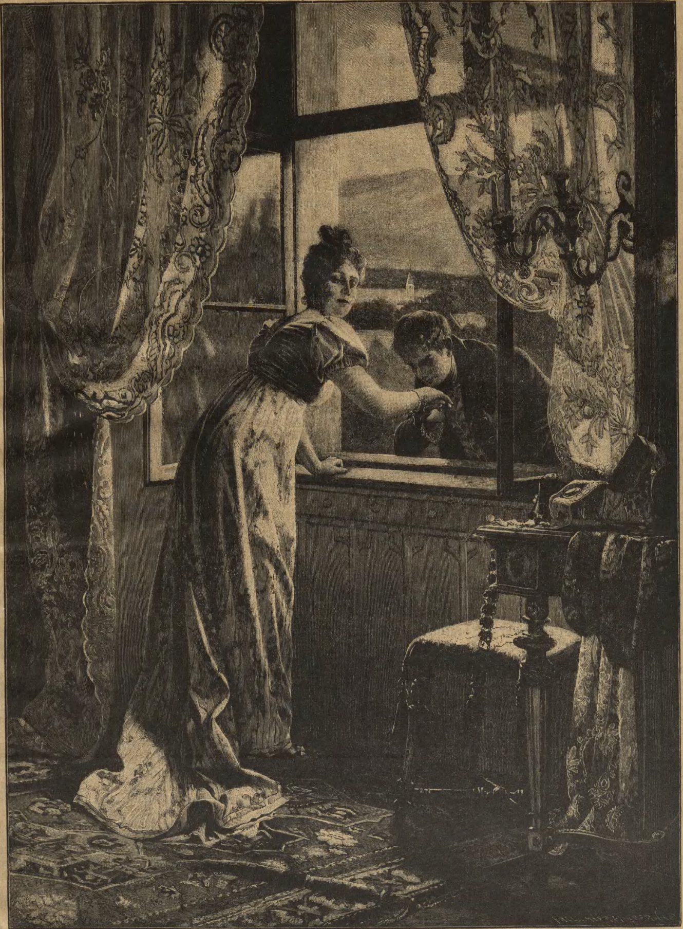
Heimliche Liebe. Nach dem Gemälde von J. Hamza. (Photographie-Verlag von Victor Angerer in Wien.)