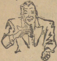
Zaoszczędzić i cerując Cerolitem

Wytw. Wynalazków Patent.: „Nowości Praktyczne”, Warszawa, Złota 37/124. (Oddz. Propagandy) tel. 235-17.