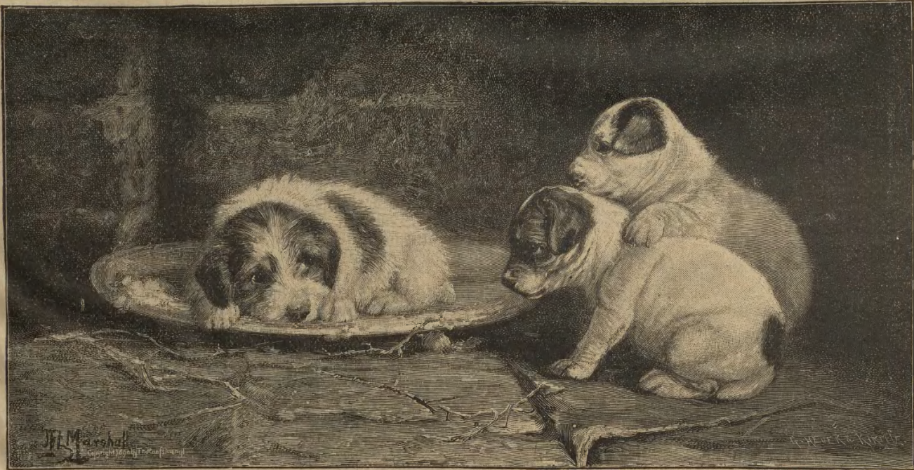
Der weiße Bello. Nach einem Gemälde von J. H. Marshall.

„Ich beteuere Ihnen bei Gott, dem Allmächtigen, daß ich weder in jener Nacht noch