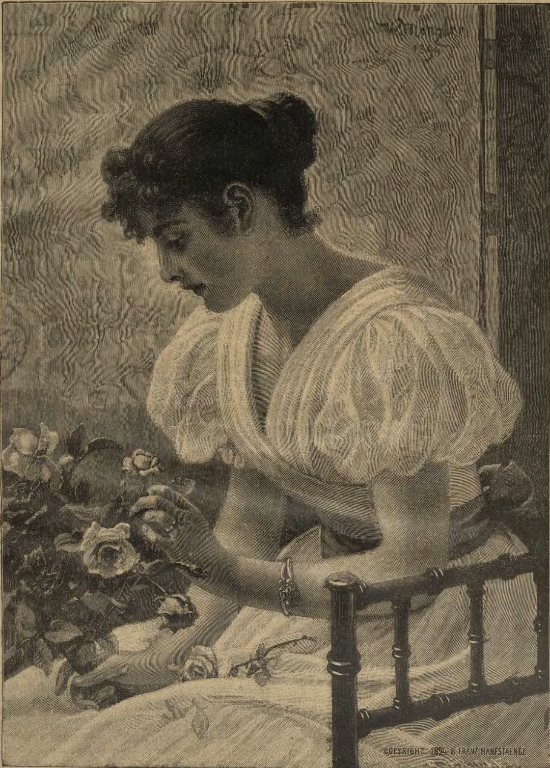
Ballblumen. Von Menzler.

Die Augen Palez blinzelten so freundlich, daß Ramon das Herz