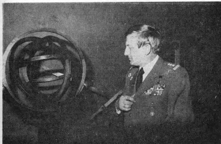
5. Płk Mirosław Hermaszewski w czasie zwiedzania Domu Kopernika

Od 1963 r. do stałego programu naszej działalności weszły doroczne wieczornice z okazji dnia urodzin twórcy teorii heliocentrycznej, organizowane przy współudziale toruńskiego oddziału Polskiego Towarzystwa Miłośników Astronomii. Odbywają się one w Wielkiej Sali Mieszkańskiej Ratusza Staromiejskiego. Programy ich staramy się tak układać, by młodzieży i społeczeństwu Torunia przybliżyć nie tylko problematykę kopernikowską, ale również przez odpowiednio dobraną tematykę odczytów, połączoną z wystawami okolicznościowymi, monodramami teatralnymi i muzyką w wykonaniu najlepszych