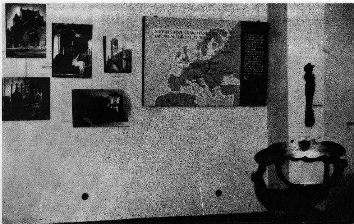
Ryc. 49. Dom Kopernika, fragment ekspozycji: Toruń — miasto Kopernika (1960 r.).