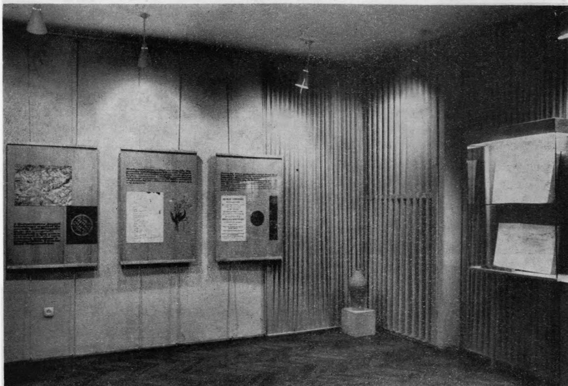
Ryc. 45. Dom Kopernika. Fragment ekspozycji: Działalność Kopernika

wy Torunia), posługuje się przede wszystkim materiałami zastępczymi, takimi jak powiększenie planu perspektywicznego z poł. XVII w. według miedziorytu Meriana, wykresy, mapki, fotografie zabytków ze szczególnym uwzględnieniem zabytków