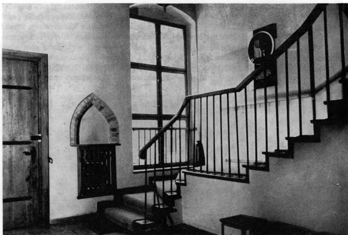
Ryc. 43. Dom Kopernika. Fragment hallu po rekonstrukcji