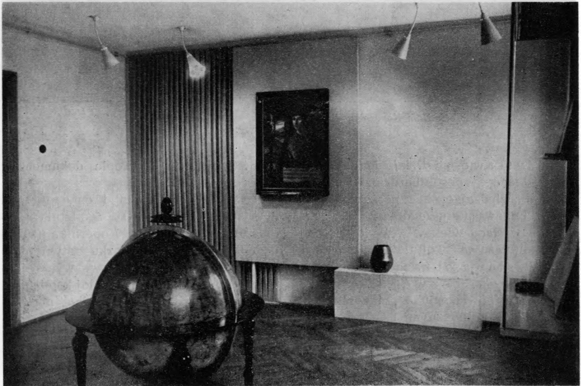
Ryc. 47. Dom Kopernika. Fragment ekspozycji: Wizerunki Mikołaja Kopernika