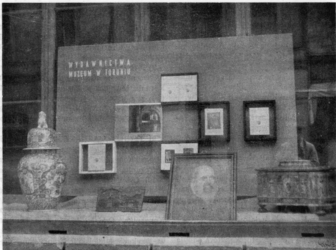
Ryc. 48. Pokaz wydawnictw Muzeum Okręgowego w Toruniu

B) WYSTAWY CZASOWE, OBJAZDOWE I POKAZY OKOLICZNOŚCIOWE: