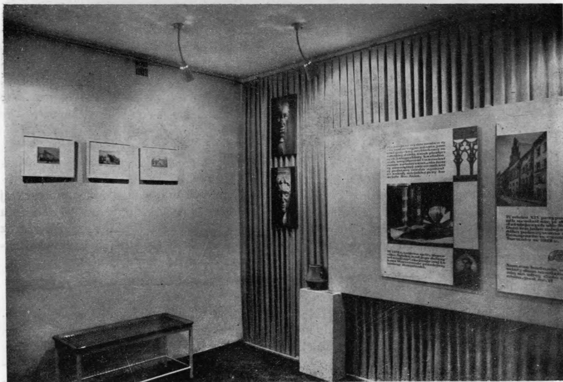
Ryc. 44. Dom Kopernika. Fragment ekspozycji: Toruń, rodzina, dom