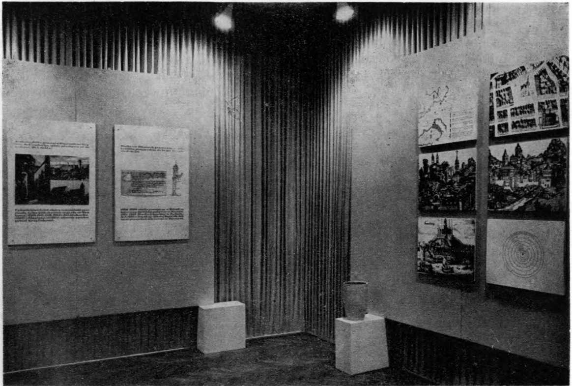
Ryc. 46. Dom Kopernika. Fragment ekspozycji: Miejsca pracy i twórczości