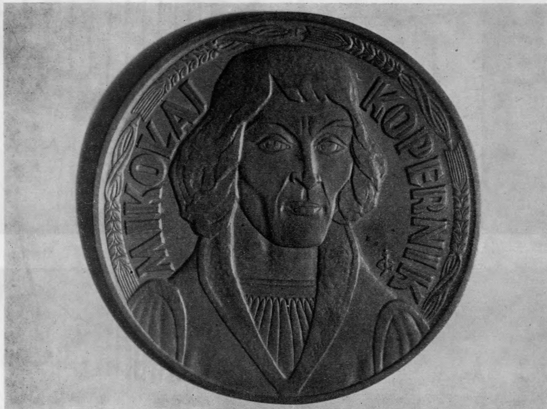
Ryc. 42. Józef Gosławski. Medal z wizerunkiem Kopernika. Projekt monety 10-złotowej

nie przez korozję, tworzącą nawarstwienia, zgrubienia i bąble. Konserwację przeprowadziła Pracownia Konserwacji Sztuki Zdobniczej w Warszawie. Po oczyszczeniu i zabezpieczeniu wykonano specjalny stelaż i gablotę z pleksiglasu, w której umieszczono szyszak. Ponadto w 1962 r. zabezpieczono specjalnym roztworem wy-