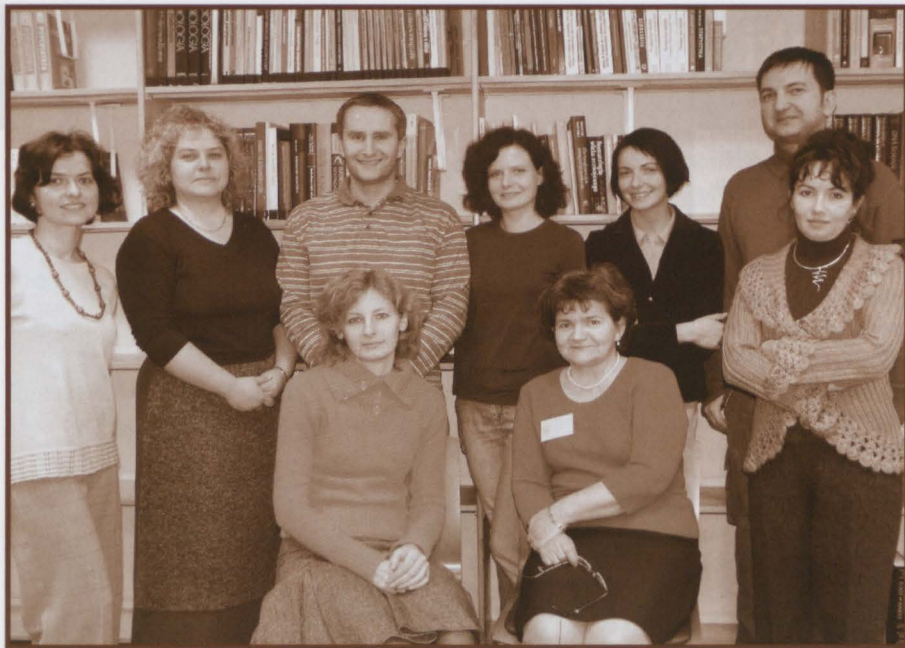
Pracownicy Działu Udostępniania Zbiorów

czeń i zwrotów książek. Trzeba zatem o niej pamiętać i kontrolować swoje konto, aby uniknąć