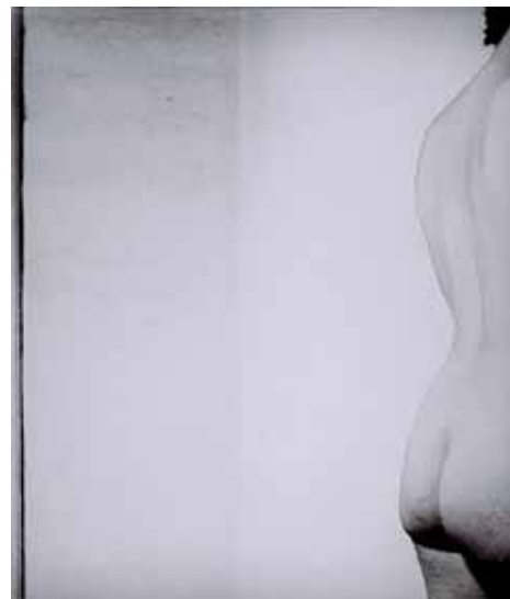
Fotografie Zdzisława Beksińskiego, lata 50.