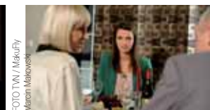
iTVN: serial „Ukryta prawda”, od pon. do pt., godz. 18.10