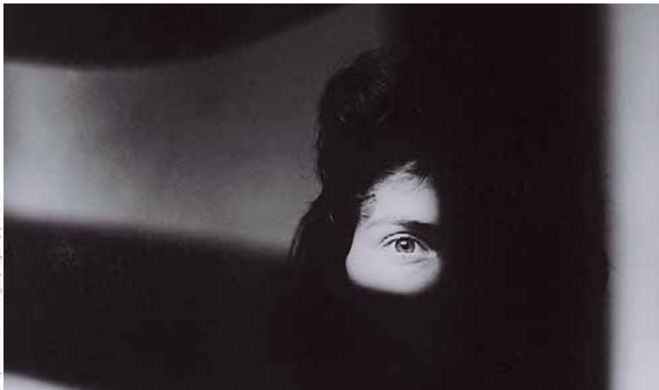
Fotografia Zdzisława Beksińskiego, lata 50.

Był głównie malarzem i rzeźbiarzem, także fotografikiem, pod koniec życia interesował się i tworzył grafiki komputerowe. Choć sztuka Beksińskiego nie należy do łatwych, jest niezwykła i zachwycająca. Mroczno - trupie krajobrazy. Zapisy strumienia myśli własnej wyobraźni. Zatopienie w często jednostajnych kolorach. Wszystko to nabiera znaczenia w różnych interpretacjach, niekoniernie zamierzonych przez artystę.