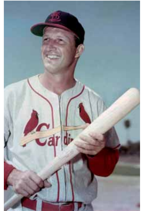
Stan Musial - pierwszy laureat Polonijnej Galerii Sław