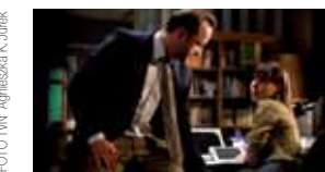
ITVN: serial „Lekarze”, 16 marca, godz. 20.25