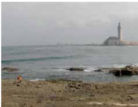
Powrót do Casablanki, kadr z filmu

18 MARCA, godz. 19.00: W ramach cyklu projekcji pod tytułem Les cinéastes polonais face à l'histoire: de la pellicule au miroir , Małgorzata Gago zaprezentuje film dokumentalny Powrót do Casablanki zreali-