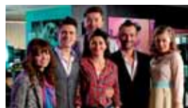
iTVN: serial „Sama słodycz”, 17 marca, godz. 21.35

06:00 Na językach 06:45 Odrobina Polski 06:55 Ugotowani program kulinarny 07:40 Sama słodycz serial 08:30 Dzień dobry TVN program 10:55 X Factor program 12:00 Stylowy 12:35 Nowy Gadżet 13:00 Doradca smaku program kulinarny 13:10 Efekt Domina 13:35 O tym się mówi 13:50 Prawo i medycyna 14:45 Kod szczęścia 15:10 Kod szczęścia 15:35 Na Wspólnej Omnibus 17:05 Bobby Chinn przyrządza Azję 17:30 Polscy faraonowie Nieznany kapłan 18:20 SAMOCHÓD MARZEN: kup i zrób program motoryzacyjny 19:00 Fakty 19:25 Sport 19:35 Pogoda 19:45 Uwaga! program interwencyjny 20:00 W roli głównej 20:25 Lekarze serial 21:15 Project Runway program 22:00 Na językach program 22:45 Polak potrafi 23:10 Magiel Towarzystwa 23:45 Desperaci film 01:30 Miasto Kobiet 02:15 Kuba Wojewódzki program 03:00 Fakty 03:25 Sport 03:30 Pogoda 03:35 Uwaga! program interwencyjny 03:50 X Factor 04:55 Brygada antymafijna 05:45 O tym się mówi