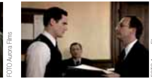
ITVN: serial „Francuskie miasteczko”, 25 czerwca, godz. 08.50