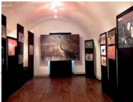
Czy znasz dolinę Bzury - fotografie Grzegorza Sawickiego

OD 26 CZERWCA DO 2 LIPCA: Obchody 15-lecia współpracy miast bliźniaczych Rillieux-la-Pape i Łęczycy z udziałem delegacji z Polski. W ramach uroczystości przygotowano kilka wystaw: Czy znasz dolinę Bzury - fotografie Grzegorza Sawickiego, O historii, sztuce, muzyce i tradycjach Polski , czy wystawę rysunków Francja w oczach dzieci . Odbędą się również występy zespołów tanecznych, spektakl i degustacja polskich specjalności. (Espace Baudelaire: 83 avenue de l'Europe, 69140 Rillieux-la-Pape);