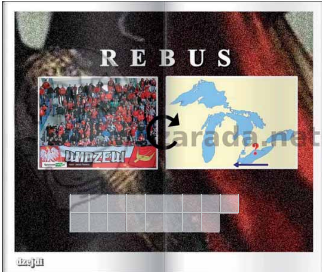
Kołowy. Pierwsze litery wyrazów rozwiązania: R.Z.