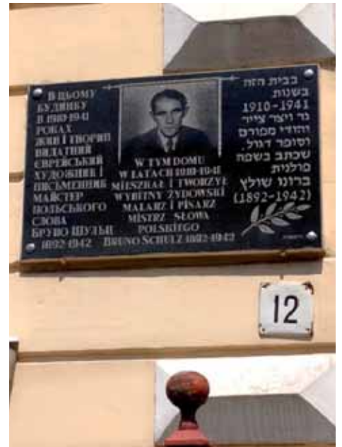
Dom, w którym mieszkał i tworzył Bruno Schulz