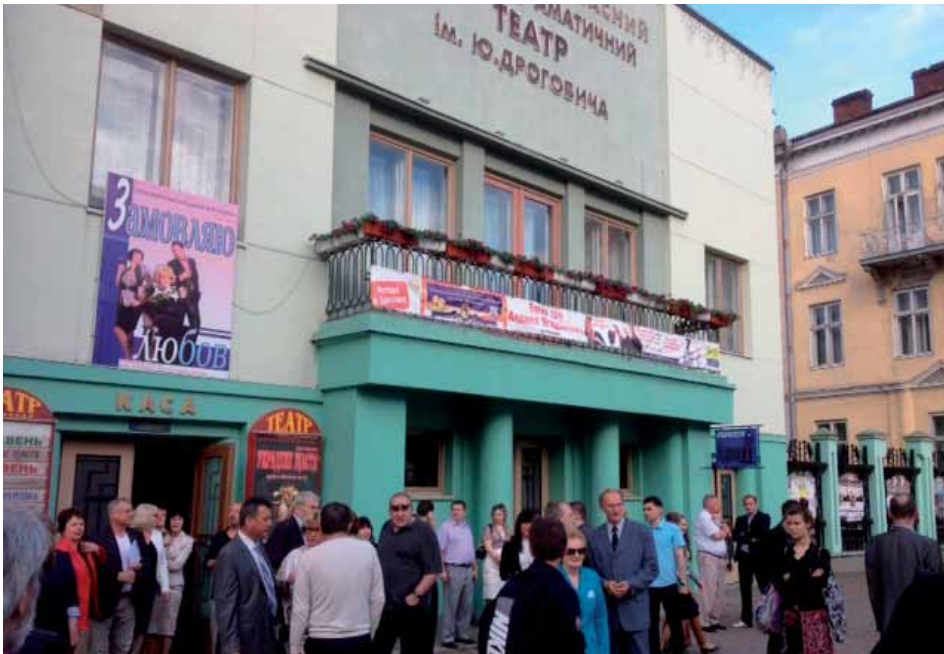
Teatr w Drohobyczu, w którym odbywały się wydarzenia festiwalu

Całość stworzyła niepowtarzalny klimat, którego motywnym przewodnikiem był zachwyt i podziw dla oryginalnej twórczości Brunona Schulza. W takim momencie odczuwa się najmocniej frustrację z powodu tego, że nie było mu dane pokazać światu więcej swojego talentu – pisarz i grafik został zamordowany przez esesmana w 1944 roku w Drohobyczu.