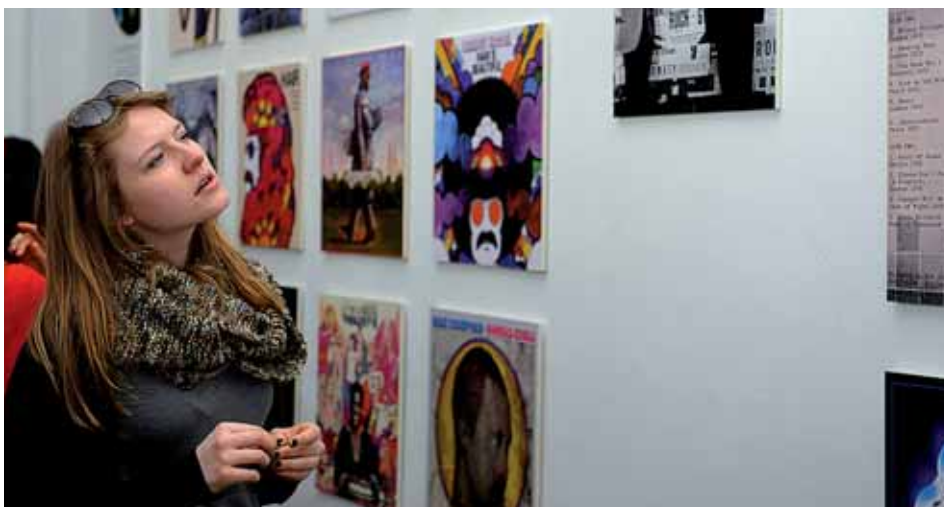
Wystawa prac Stanisława Zagórskiego i Rostawa Szaybo w Galerii Kordegarda w Warszawie

Najpierw artysta przeciągnął pobyt w związku z zorganizowaną przez Polish Institut of Art & Science wystawą jego prac. Potem powziął decyzję o zawojowaniu Ameryki. „Narysowałem kilka prac i nikt ich nie chciał – wspominał.