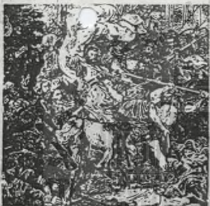
FRAGMENT Z OBRAZU „GRUNWALD” JANA MATEJKI

W ROKU 1410 dnia 15 lipca, połączone wojska polskie, litewskie, smoleńskie, kijowskie, czeskie i morawskie, silne swoją jednością stoczyły na polach Grunwaldu zwycięski bój ze śmiertelnym wrogiem Słowiańszczyzny – krzyżakami.